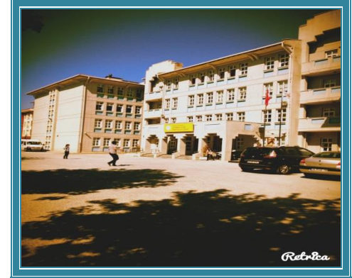
Okulumuzun birimlerinden görünüm - 4